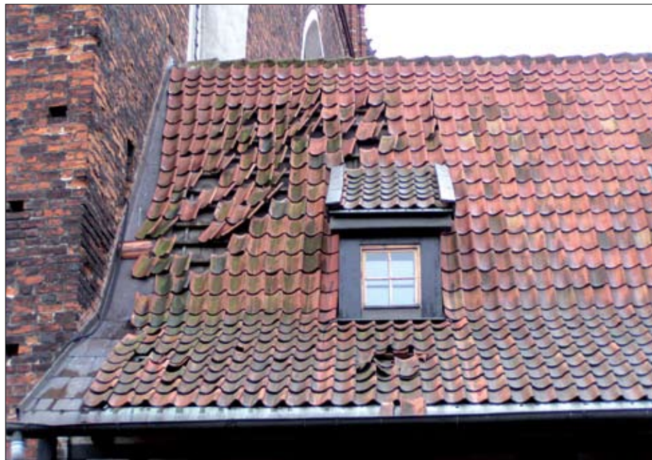
Dom ryglowy po wichurze 14 X 2009 r.