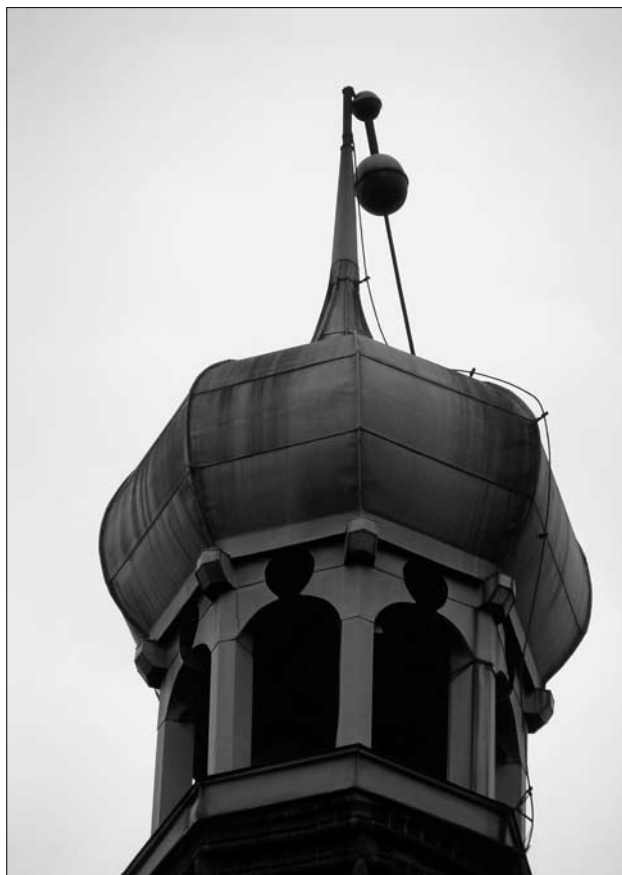
Złamana iglica po wichurze 14 X 2009 r.