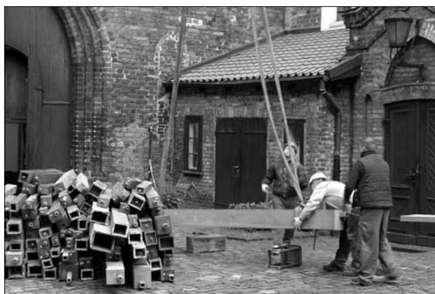
Transport puszczalek na poddasze kościoła 7 V 2010 r.

ną – z wysp indonezyjskich. Mszę Św. celebrowali misjonarze werbiści z Indonezji i Togo. Na uroczystej liturgii był obecny ambasador Indonezji wraz z korpusem dyplomatycznym.