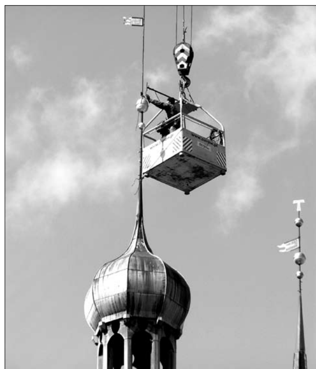
Montaż odrestaurowanej iglicy 20 IV 2010 r.

22 V – na czuwaniu modlitewnym w wigilię zesłania Ducha Świętego kaplicę Św. Anny, jak każdego roku, wypełnili członkowie ruchów maryjnych i misyjnych z terenu Trójmiasta.