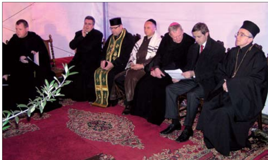
Asyż w Gdańsku 27 X 2009 r.

25 X – o godz. 12.00 w dużym kościele odbyła się tzw. Missa Flores – z bogatą egzotyczną oprawą muzyczną i tanecz-