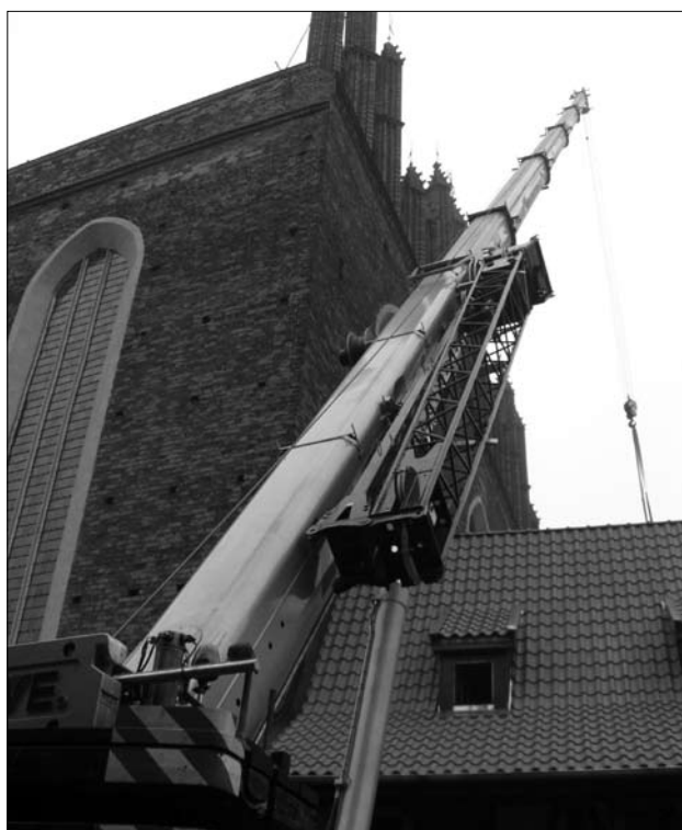
Transport puszczalek na poddasze kościoła 7 V 2010 r.